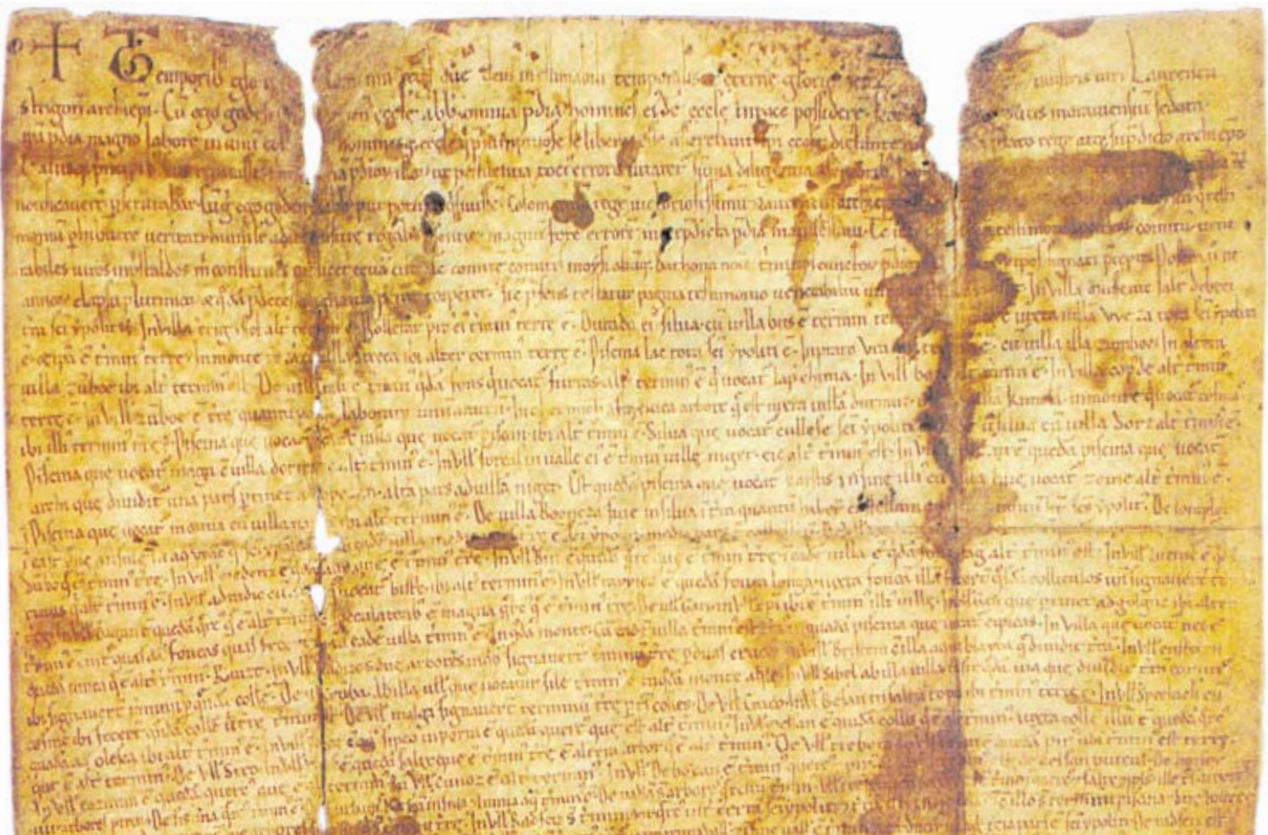
Zoborská listina z roku 1113 - najstaršia písomná správa o obci Lužianky (Sarló)