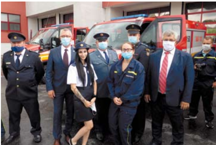
Starosta obce a členovia DHZO pri preberaní vozidla druhý z ľava štátny tajomník MV SR a vedľa neho prezident HaZZ SR.