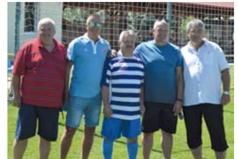
Zástupcovia jednotlivých celkov pri zahájení