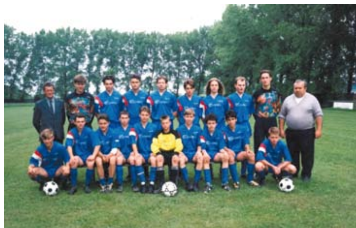
Mužstvo z postupových rokov

Po nevydarenom spojení s klubom TJ Strojár Nitra sa futbal z Lužianok vytratil a postupne upadal. Po dlhšej odmlke, kedy bol futbal v Lužiankach na vedľajšej koľaji, sa v 90-tych rokoch znovu ujal mladých futbalistov, ktorý prešli žiackou kategóriou a mohli ďalej pokračovať v dorasteneckej. Začiatok bol síce ťažký, lebo sa muselo začínať od najnižšej okresnej súťaže (čo bola v tom čase II. trieda), ale potom lužiansky dorastenci preleteli raketovou rýchlosťou až do IV. ligy. Spôsob akým to dosiahli bol naozaj impozantný, lebo sa to udialo spôsobom „čo rok to postup“. Sezóna 1994/95 postup