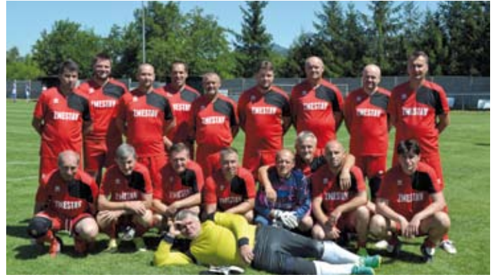
Domáci výber v plnej paráde (ešte vládali pózovať)