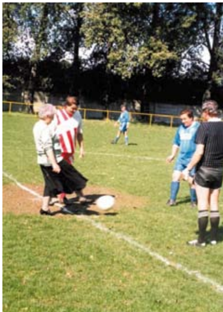
Slávnostný výkop na jednom z Memoriálov Jozefa Bojdu