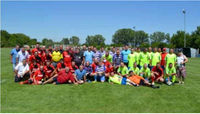
Spoločný záber pred začiatkom turnaja