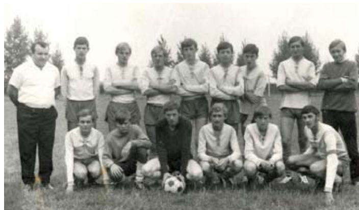
Naši dorastenci v sezóne 1969/70