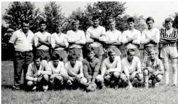
Naši dorastenci okolo roku 1965